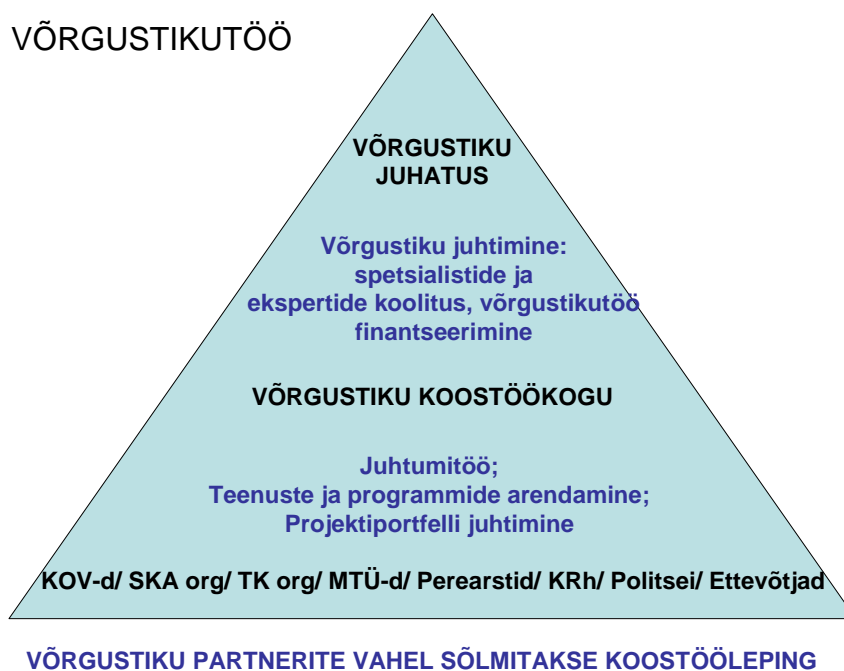
Joonis 1. Võrgustikutöö planeerimine ja juhtimine organisatsioonide koostöös [KM3]

Peale võrgustiku koostöökokkuleppe sõlmimist määrab/valitakse iga partner oma esindaja(d), kes hakkavad partnerorganisatsiooni reaalses võrgustikutöös esindama ja selles osalema. Neist partnerorganisatsioonide poolt määratud/valitud isikutest moodustub võrgustiku koostöökogu, kelle ülesandeks on selle võrgustiku töös osaleda vastavalt vajadustele ja kokkulepitud reeglite kohaselt.